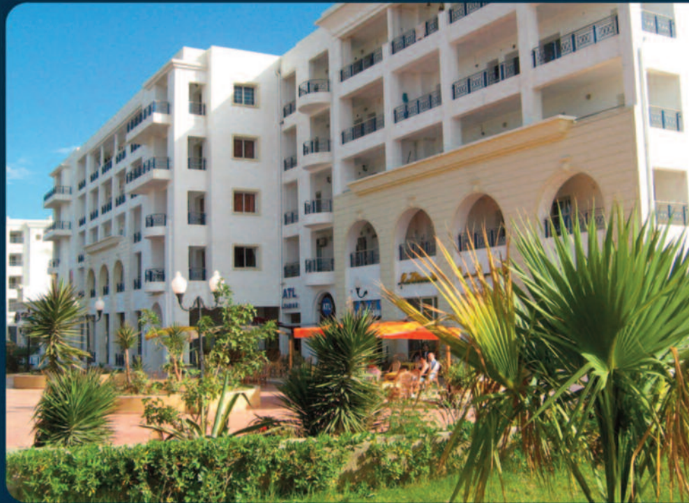
SLIM CENTRE I