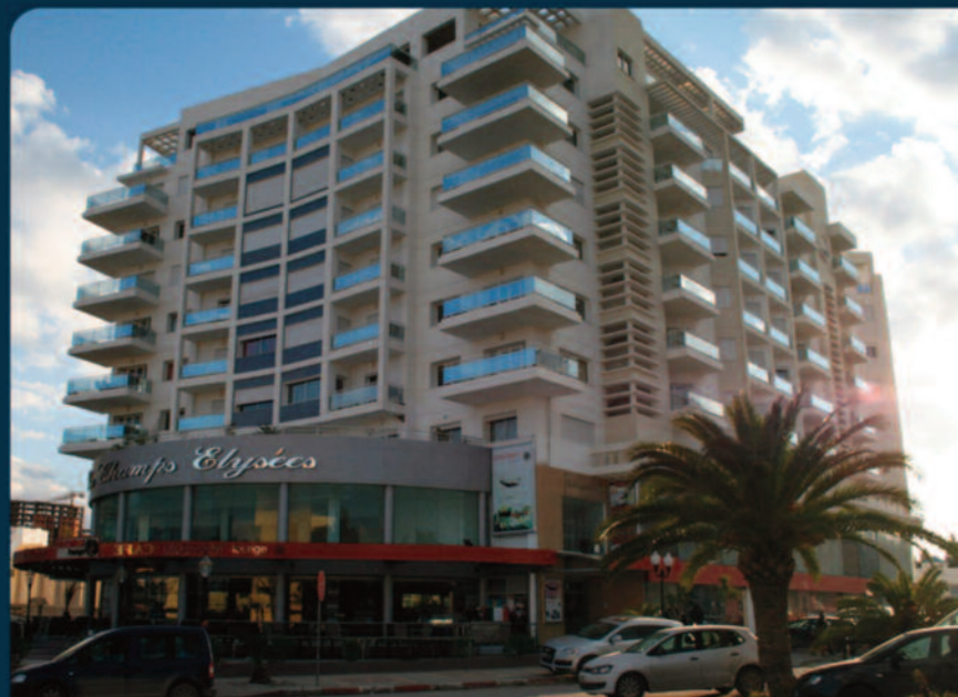
SLIM CENTRE II